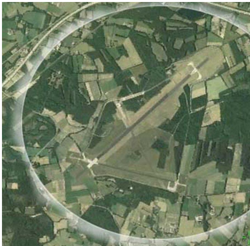
Fig. 1 Luchtfoto van vliegveld en omgeving

Met het vertrek van Defensie komen de terreinen van vliegbasis Twente beschikbaar voor gewenste ontwikkelingen. De basis bestaat uit twee delen, het eigenlijke vliegveld en het Zuidkamp. Het laatstgenoemde is opgenomen in de al lang bestaande planning van de wijk Vaneker in noord Enschede en wordt niet verder besproken.