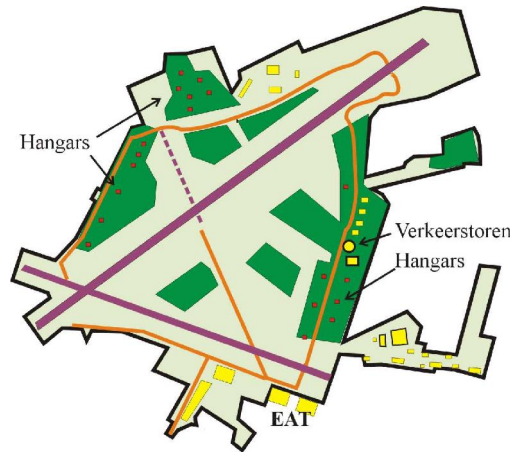
Fig. 2 Overzicht vliegveld, in militair gebruik

Verscheidene voorstellen voor een nieuwe bestemming van het vliegveld hebben het licht gezien. De belangrijkste alternatieven zijn Groen en Burgerluchtvaart. Met deze notitie wil landschapspark Lonneker Land deelnemen aan de discussie door een Groen voorstel uit te werken.