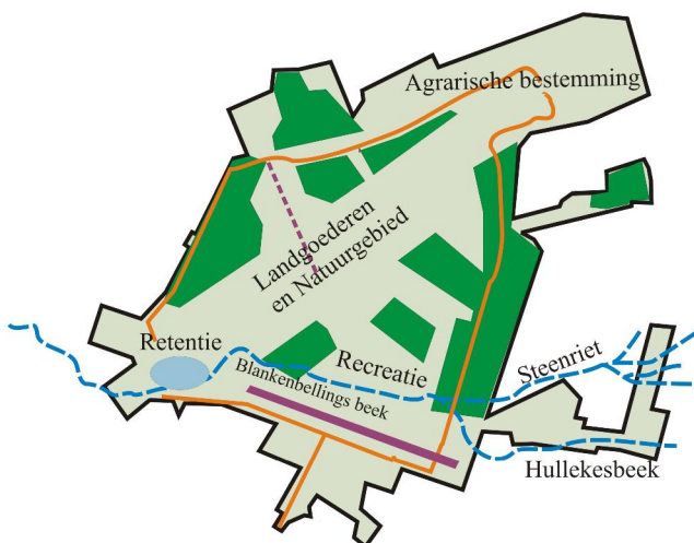
Fig. 4 De elementen die een plaats moeten vinden op het vliegveld. De getekende beken zijn op de eerste topografische kaarten (ca. 1860) te vinden. Een zorgvuldige analyse van de natuurwaarden en ecologische mogelijkheden moeten aan de positionering voorafgaan.

Aan de indeling moet een zorgvuldige analyse van de natuurwaarden en ecologische mogelijkheden voorafgaan.